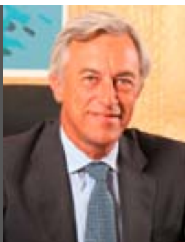
ALFREDO BONET BAIGET

Secretario de Estado de Comercio Exterior del Gobierno español